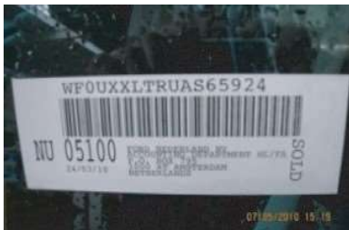
Bild 1 Foto der Fahrgestellnummer

Foto muss scharf sein und die Beschädigung sichtbar. Für jede Beschädigung schicken Sie mindestens 4 Fotos: