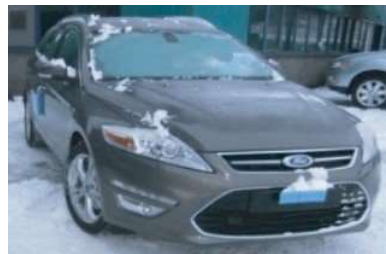
Bild 2 Foto von dem ganzen Fahrzeug