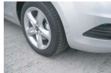
Bild 3 Beschädigung Distanz von 1 Meter