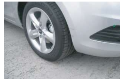
Bild 3 Beschädigung Distanz von 1 Meter