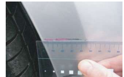
Bild 4 Beschädigung Mit dem Messgerät