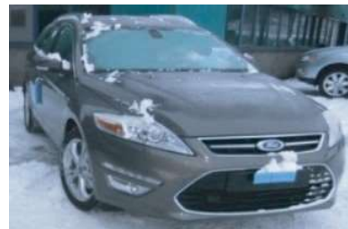
Bild 2 Foto von dem ganzen Fahrzeug