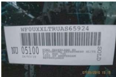
Bild 1 Foto der Fahrgestellnummer

Foto muss scharf sein und die Beschädigung sichtbar. Für jede Beschädigung schicken Sie mindestens 4 Fotos: